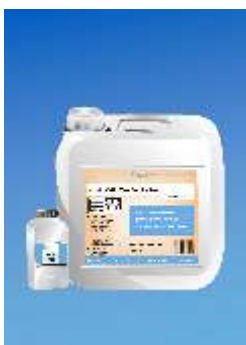
884 2-C Aqua Lacquer Perfect Duo Pusiausvyra matinis (PM)

Aukštos kokybės, vandens ir poliuretano pagrindo lakas. Labai tinka didelio judėjimo objektuose ilgalaikiam blizgesiui ir apsaugai nuo nusitrynimo palaikyti. Naudojamas vis tip elastingo parketo grindims. Atitinka apkrovimo klasę C pagal Austrišką normą C 2354. GISCODE W 3