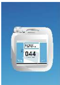
044 Europrimer Multi Universalus Gruntas