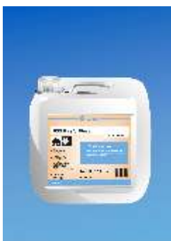
855 Euro Lacquer Basic

Tirpiklio pagrindo medžio sandarinimo produktas, kur reikia sumaišyti su šlifavimo dulke (daugelis dydis 80-100). Tinka vis tip medienai. Užpildo iki 2 mm gylio tarpus. Gali ilgai likti atidaryti, greitai džiantys, lengvai šveičiami. Puikios sujungimo vietų užpildymo savybės, mažai sukrentantys. Neturintys aromatinių tirpiklių. Pavojingos medžiagos: prašome atkreipti dėmesį saugumo reikalavimus ir pavojingų medžiagų taisykles. GISCODE G 2