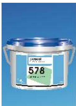
578 Eurosafe Uni Polaris Universal s Klijai

Rekomenduojami PVC dizaino dangoms, taip pat veltinio dangoms.