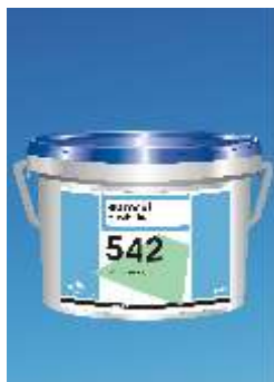
542 Eurofix Tiles