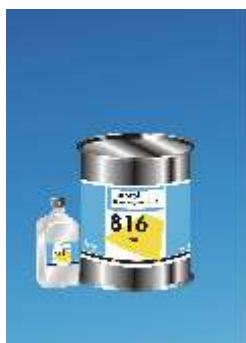
816 Epoxy Potting - Mišinys