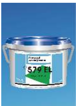
579 Universal Adhesive EC Polaris Universal s Klijai EL