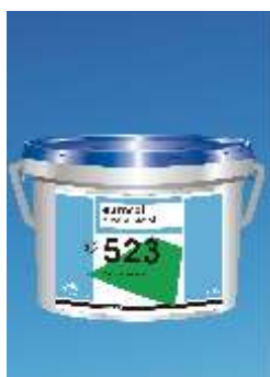
523 Eurostar Tack EL PVC-Klijai EL