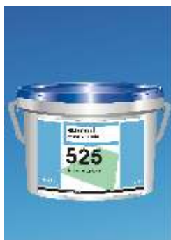
525 Eurosafe Basic Universal s Klijai