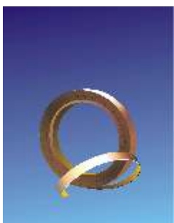
801 Varin Juosta