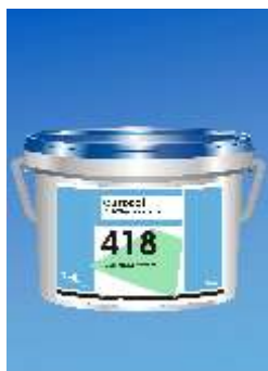
418 Euroflex Lino Plus

Valymo priemon : Tirpiklis 694 (10kg) – dar nesukiet jusiems klijams