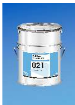
021 Euroblock Reno dvikomponentis Epoksidinis Gruntas