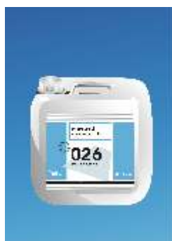
026 Euroblock Multi Izoliuojantis Gruntas