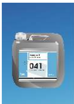
041 Europrimer EL Dispersioninis Gruntas