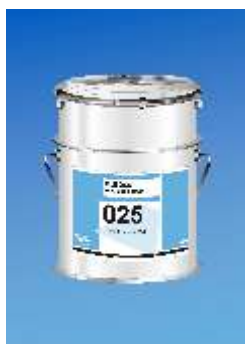
025 Euroblock Deep