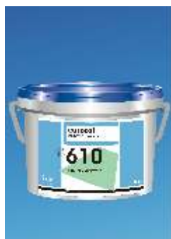
610 Eurostar Lino LK Linoleumo Klijai