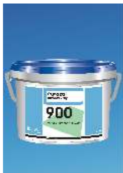
900 Europlan DSP Dispersinis Išlyginamasis Mišinys