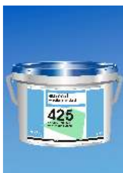
425 Euroflex Standard Kilim Klijai