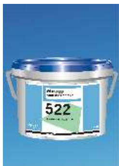
522 Eurosafe Star Tack