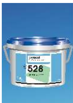
528 Eurostar Allround Universal s Klijai

Greitai džiantys klijai PVC grind dangai, tekstilini s dangoms su gumos pagrindu. Stiprus klij galutinis sukibimas. Naudojami ant paruošt , gerian i dr gm pagrind .Klojimo laikas apie 0min. Be skiedikli . GISCODE D 1