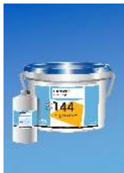
144 Euromix PU 2-C-PUR -Klijai