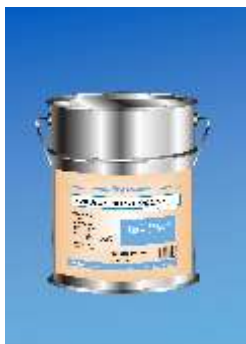
870 Wood-putty Solution