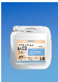
867 Aqua Lacquer Easy Future Pusiausvyra matinis (PM)

Vandens pagrindo, akrilinis lakas skirtas padengti vis tip standartiniams parketo grindims. Tinkamas gyvenamosioms patalpoms ir objektams, kuriuose galima mažas arba vidutinis judėjimas. Atitinka apkrovimo klasę A pagal Austrišką normą C 2354. GISCODE W 3