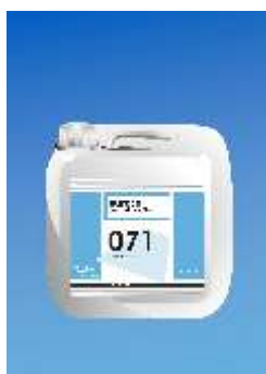
071 Europrimer Fibre Gruntas su pluoštu

- nereikalingas šlifavimas ant Forbo EP/PU grunto