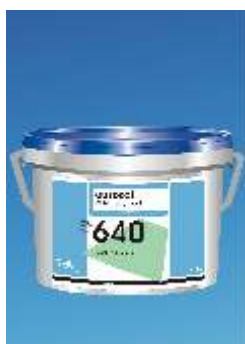
640 Eurostar Unicol