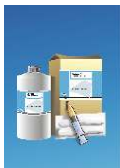
Linoleum Doctor Klijai Taisymui

taisymo reikmenis eina: - 1 buteliukas Linoleum Doctor 0,5 kg; - 2 fistul s.