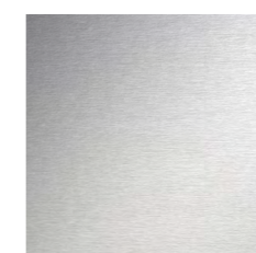
Нержавеющая сталь 1190